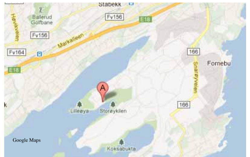
Lilløyplassen naturhus: Oksenøyveien 100 på Fornebu. Buss 31 til holdeplass Fornebu vest - følg skilting. P-plass i enden av Oksenøyveien.