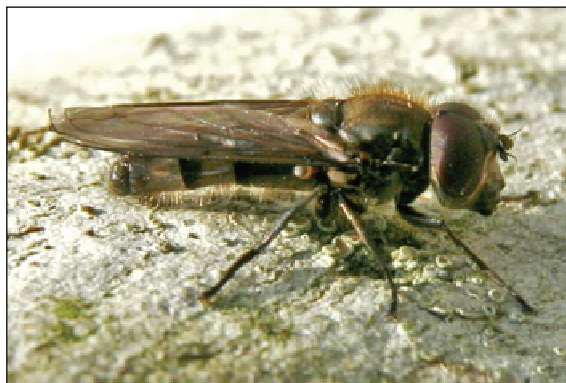
Figur 2. Liten ramsløkflue Cheilosia fasciata , hann.

Øynene hårete. Følehornene brunsvarte. Avstanden mellom nedre øyekant og munnkant stor, så mye som cirka \frac{1}{4} av hodehøyden. Føttene gule på basale \frac{1}{3} - \frac{1}{4} av skinnebeina. Bakkroppen langhåret og relativt slank.