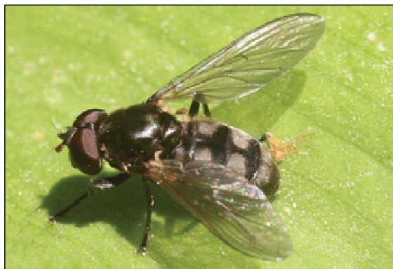
Figur 3. Stor ramsløkflue Portevinia maculata , hann.

Øynene nakne, uten hår. Følehornenes tredje ledd oransje. Avstanden mellom nedre øyekant og munnkanten kort, bare litt lenger enn dybden på følehornas tredje ledd. Føttene svarte, bare knærne smalt gule. Bakkroppen korthåret og forholdsvis brei, alle bakkropsledd tydelig breiere enn lange.