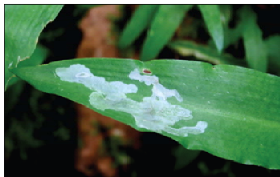
Figur 1. Bladmine med ung larve av liten ramsløkflue.

Artene har litt forskjellig flyperiode. Liten ramsløkflue klekkes enkelte år allerede sist i april og flyr til begynnelsen av juni. Den er samkjørt med perioden da ramsløkplanten har friske blader. Stor ramsløkflue flyr litt senere, fra slutten av mai og utover i juni. Den sitter ofte på bladene og soler seg, og er lite sky.