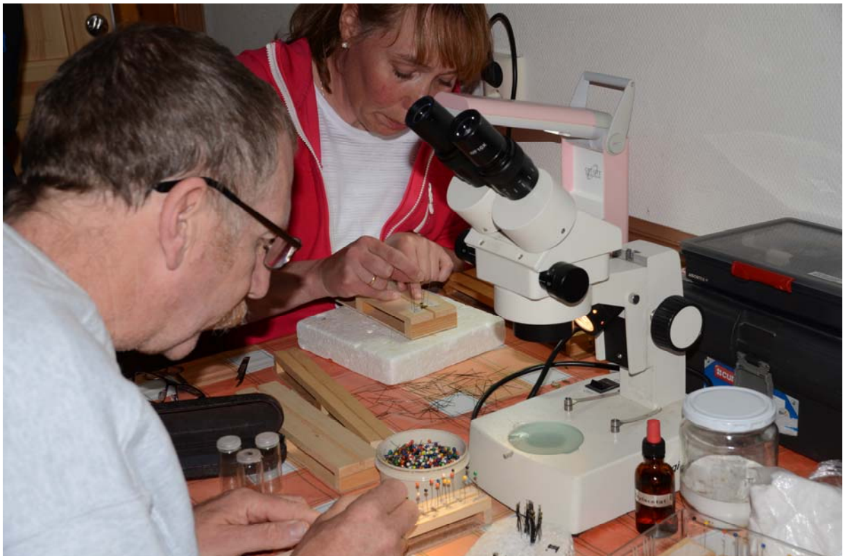
Fra Norsk entomologisk forenings sommertreff i Aurland 19. - 21. juni. Gruppefoto (øverst) og foto av deltagere ivrig opptatt med å preparere dagens fangst (nederst).