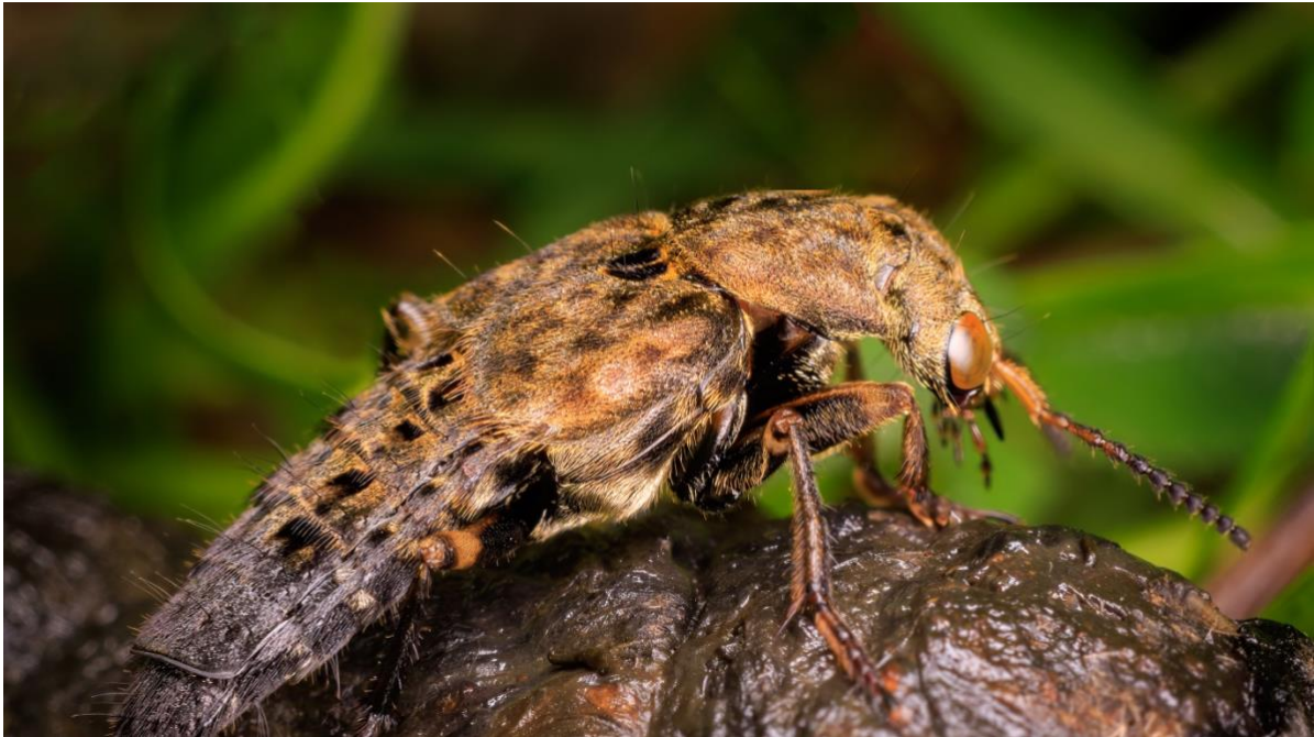
Ontholestes tessellatus, Foto: Jan Erik Nygård

Velkommen til artskurs i kortvinger. Kortvingene utgjør den største familien av biller i Norge, med over 1050 arter. På dette kurset vil vi fokusere på å kjenne igjen de forskjellige underfamiliene av kortvinger, og det vil bli anledning til å gå dypere i taksonomien om ønskelig.